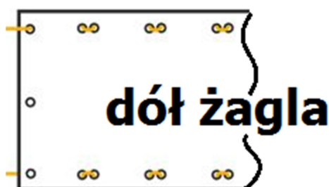
Rys 1. Poprawne mocowanie żagla

Dziękujemy za dokonanie zakupu ! Życzymy miłego odpoczynku i samych radosnych chwil pod naszymi żaglami